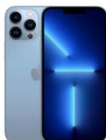
Apple iPhone 13 Pro 128 ГБ небесно-голубой